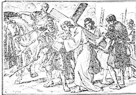
ጌታችን ኢየሱስ ክርስቶስ መስቀሉን ተሸክሞ ወደ ቀራንዮ ለሂድ ።

የተቀበላቸውን ፡ ሆኑን ፡ ሕማማተ ፡ መስቀል ፡ ፈጽሞ ፡ በአካለ ፡ ሥጋ ፡ ስኩብ ፡ በመቃብር ፡ ሆኖ ፡ አርፎበታል ፡ ማቲ ጳጌ ጳፀ ጳፀ ማር ፡ ሀጌ ፡ ማፀ ፡ ማጌ ፡ ሉቃ ፡ ጳፂ ፡ ሃፂ ፡ ሃፀ ፡ ዮሐ ፡ ሲ፱ ፡ ማፀ ፡