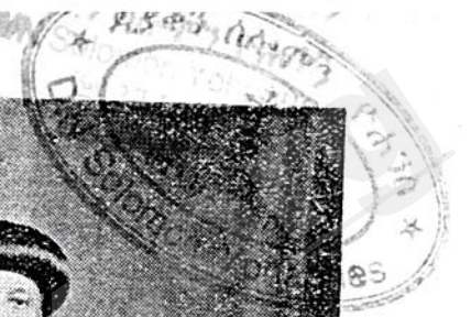
ብዑስ ፡ ኦባ ፡ ባስልዮስ ፡ ሊቀ ፡ ጳጳሳት ፡ ዘኢትዮጵያ ።