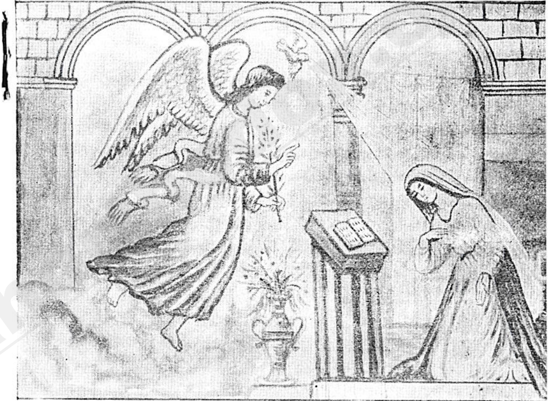
በስድስተኛው ወር መልአኩ ቅዱስ ገብርኤል የጌታን ልደት ለማብሰር ወደ እመቤታችን ተላከ ። ሉቃስ ም ፩ ቀ ፳፮ ።

በያዕቆብም ፡ ቤት ለዘለዓለም ይነግሣል ፤ ለመንግሥቱም ፍጻሜ የለውም ብሎ ያበሰራትን ሞገሳዊ ጸጋ በመጠልከትና በማድነቅ ነው ። ሉቃ ም ፩ ቀ ፱፩-፱፫ ።