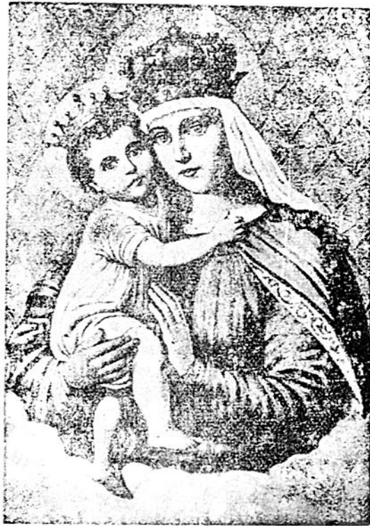
ናሁ እም ደኢህሴ ያስተበፀውኒ ነሱ ትውልድ = ሱቃ ም ስ ቀ ሳ ፳ ።

ለኃጢአተኞች ታማልዳላች አሏት በማለት እውነትን ከሐ ሰት ጋር ማጋጨት አይገባም ።