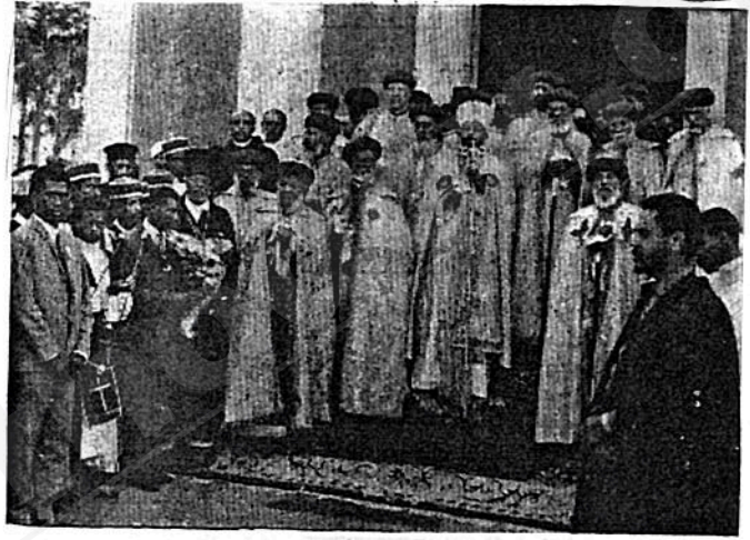
ብፁዕ ወቅዱስ ፓትርያርክ የመዐርግ ልብሳቸውን እንደለበሱ በቅድስት ማርያም ቤተ ክርስቲያን ዓውደ ምሕረት ቆመው የካህናቱን ዝማራ ሲያዳምጡ ።

በዘመ ይቤሉ አዕማዶ ሰላም ባስልዮስ ወቴዎፍሎስ ፤ አሠነዩ ዓለመ እንተ በልዩ ኃይለ ሥላሴ ንጉሠ ነገሥት ፤ ማለት የሰላም ምስራቆች ባስልዮስና ቴዎፍሎስ እንዲከበሩ ንጉሠ ነገሥት ኃይለ ሥላሴ ያረጀውን ዓለም አደስ (አሳመረ) የሚለውን ግሥገሥ ገሠው ፳ ደቂቃ ያህል አሸበሸቡ ።