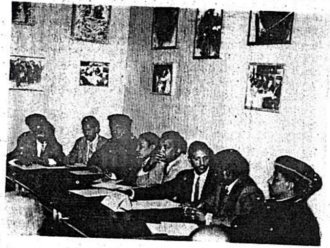
ጉባኤው በንዑስ ደርግ እየተከፈለ በጉዳዩ ሲወያይ ፤

፩/ ቤተ ክርስቲያን የዕውቀትንና የሰውን ኃይል በሚገባ በሥራ ላይ ለማጥፋት የካህናት ማሰባሰቢያ ድርጅት አቋቁማለች ።