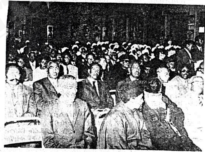
ከሚያዝያ ፳፭ —ሚያዝያ ፴/ ፷፬ ዓ፡ ም፡ በተደረገው ዐቢይ ጉባኤ በየዕለቱ ከተገኙት ካህናት ፤ ሊቃውንት ፤ መኳንንትና ምእመናን በከፊል ።

መ/ የአዲስ አበባ አድባራትና ገዳማት አስተዳዳሪዎችና ምዕመናን ወኪሎች፤ ጥሪ የተደረገላቸው የመንግሥት ባለሥልጣናትና የልዩ ልዩ ድርጅቶች ተጠሪዎች ተካፋዮች በሆኑበት ከፍተኛ ጉባኤ ሰፊ ውይይት ተደርጓል ።