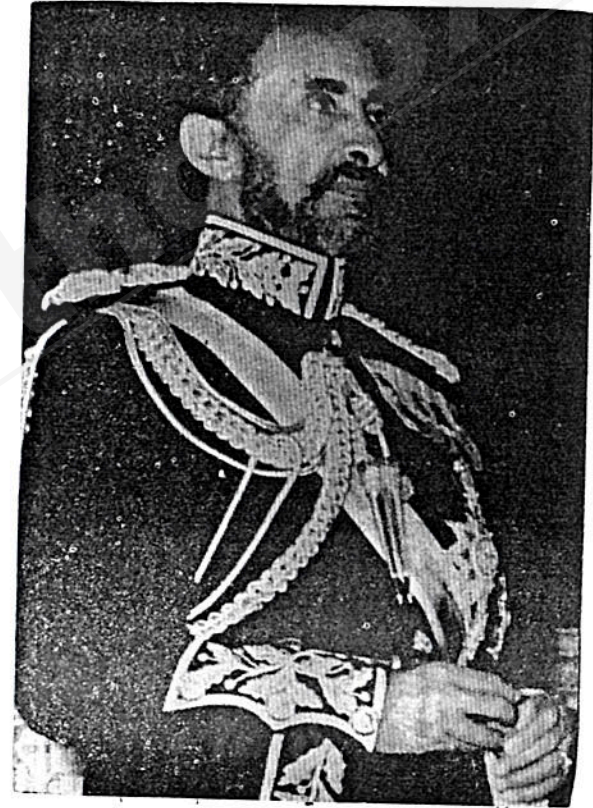
ግርማዊ ቀዳማዊ ኣጼ ኃይለ ሥላሴ ንጉሠ ነገሥት ዘኢትዮጵያ