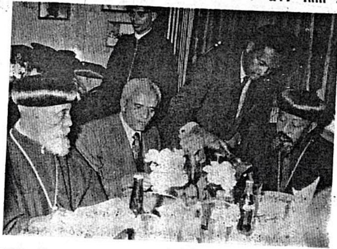
ብዑስ ወቅዱስ ፓትርያርኩና ክቡር ጠ/ሚኒስትር በግብግጡ ላይ ፤ ፍጻሜ ድረስ ልዩ ልዩ መንፈሳውያት መዝሙሮችን ሲያሰሙ ውለዋል ። ከዚያ በኋላ ጠቅላላ የበዓሉ ፍጻሜ ሆኗል ።

በግብግጡም ላይ ሊቃውንት በየተራ ንግግር አድርገዋል ። ቅጂዎችንም አበርክተዋል ። የሰዋሰወ ብርሃን ቅዱስ ጳውሎስ ት/ቤት ደቀ መዛሙርትም እስከ ግብግጡ