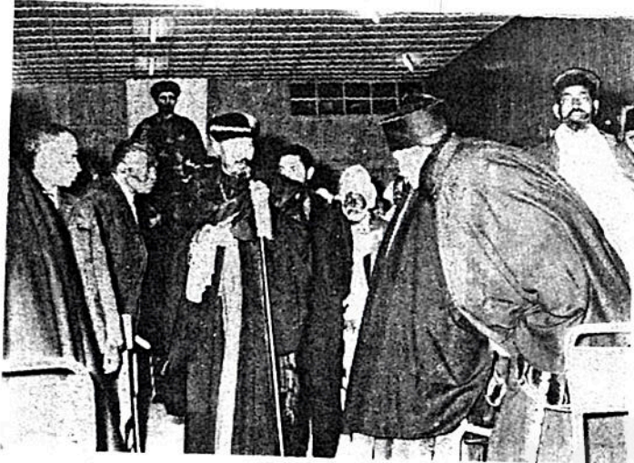
ብፁዕ ወቅዱስ ፓትርያርኩ ለጉባኤው የመምሪያ ቃለ በረከት ከሰጡ በኋላ ከአዳራሹ ሲወጡ ።

«ቤተ ክርስቲያን ብለን የምንጠራው ማንን ነው? ቤተ ክርስቲያን ስንል ምን ማለታችን ነው? ካህኑም ምእመኑም ጳጳሳትም ያሉበት ማኅበር አይደለም? ቤተ ክርስቲያንን የክርስቲያኖች ቤት የክርስቲያኖች አንድነት የሚያሰኛት? እንዲህ ከሆነ ጳጳሳት ብቻ ሳይሆኑ ካህናትም ብቻ ሳይሆኑ ምእመናንም ጭምር በግልጽ በገብረት የግዴታውና የኃላፊነቱ ተካፋዮች ናቸው ማለት ነው ።