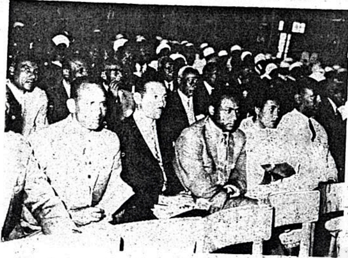
የፓርላማ ዓባሎች ፣ ጥሪ የተደረገላቸው ታላላቅ ሰዎችና ካህናት የቅዱስነታቸውን ቃለ በረከት ሲያዳምጡ ፤

በዚህ ረገድ ለተቀደሰው ዓላማ በአንድነት መገናኘትና ተባብሮ መሥራት የቤተ ክርስቲያናችንን ሕይወት የሚያድስ የአገራችንንም ዕድገት የሚያጎለግል ስለሆነ ጌታ