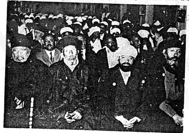
የአድባራት አለቆችና ካህናት የቅዱስነታቸውን የመምሪያ ቃለ በረከት በተመስጠ ሲያዳምጡ ።

ሁላችሁንም እዚህ የሰበሰብናችሁብላይ የተገለጹትን የቤተ ክርስቲያን ተግባሮች በሥራ ለመግለጽ የነበረውን የቤተ ክርስቲያን ሕግና መሠረታዊ አቋም በመከተል ሕዝበ ክርስቲያን በሚኖርባቸው ቤተ ክርስቲያን በሚገኝባቸው ሰበካዎች በየአጥቢያው የቤተ ክርስቲያን የሥራ ጉባኤዎችን በየደረጃው በማቋቋም ፣ የነበረውንም በማስፋፋት መሥራት አስፈላጊ ሆኗል ። የኢትዮጵያ ቤተ ክርስቲያን ሀገረ ስብከት በተዘረጋበት ሥፍራ ሁሉ በተሟላ ሁኔታ የሚቋቋመውና የሚደራጀው ይህ የየአጥቢያው ቤተ ክርስቲያን ጉባኤ በአጥቢያው ቤተ ክርስቲያን አስተዳዳሪ/ሰብሳቢነት ከካህናቱም ከምእመናኑም የተወጣው ዓባሎች የሚገኙበት ሆኖ በዚያ ሰበካ ውስጥ ባለው የቤተ ክርስቲያን አስተዳደርና ንብ