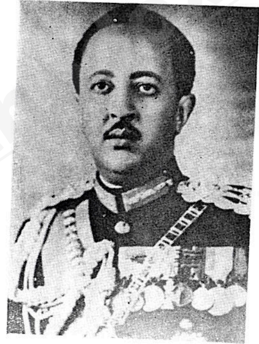
ለዑል መርዕድ አዝማች አስፋ ወሰን ኃይለ ሥላሴ የኢትዮጵያ ንጉሠ ነገሥት መንግሥት አልጋ ወራሽ።