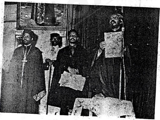
ብዑስ ወቅዱስ ፓትርያርኩ ጉባኤውን በቃለ ለርከት ሲከፍቱ ።

በዚህ ቀን አባቶቻችን እየተሰበሰቡ በመወያየትና በመነጋገር፤ በሃይማኖትና በመንፈሳዊ ሥራ ረገድ ለአገርና ለሕዝብ የሚጠቅም ብዙ ቁም ነገር ፈጽመውበታል ። ዛሬም እኛ ይህን ርክበ ካህናት የሚባለውን ዕለት ምክንያት በማድረግ የተሰበሰብነው የቆየውን በመከተልና በማስፋፋት እንጂ አዲስ ሥርዓት በመጀመር አይደለም ።