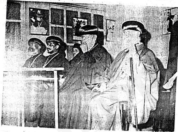
ብፁዕን ሊቃና ጳጳሳትና ጳጳሳት በሰባክያኑ ጉባኤ ላይ ተካፋዮች ነበሩ ።

ቤተ ክርስቲያን ይህን ሠርታ ፈጸመች ፣ ወደፊት ይህን ታቅድና ትሥራ በተባለው መጠንም ባይሆን በዚሁ ዐቢይ ጉባኤና ከዚያም በኋላ በተደረጉት ተከታታይ ጉባኤዎች ላይ አልፎ አልፎ በወቀሳ መልክ የቀረቡ አልሠራችም፤ አትሠራም፤ ልትሠራም አትችልም