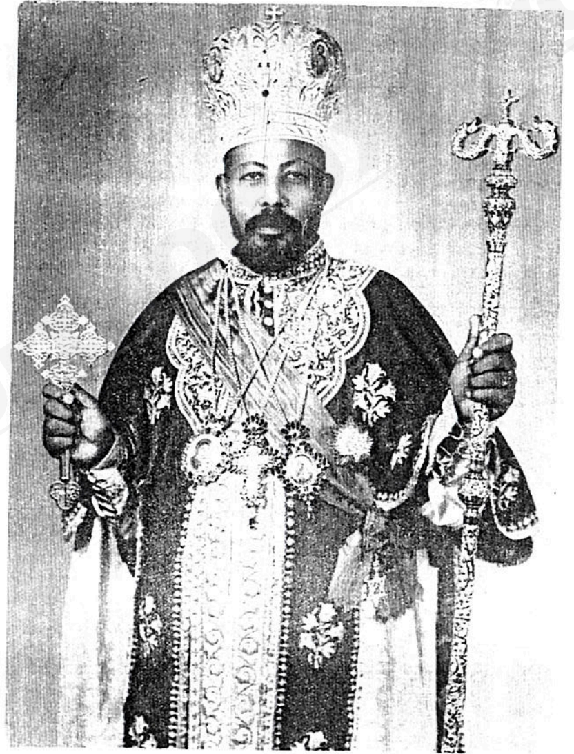
ብፁዕ ወቅዱስ ቀዳማዊ ቴዎድሎስ ፓትርያርክ ርእሰ ሊቃነ ጳጳሳት ዘኢትዮጵያ