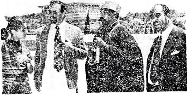
ብዙዕነታቸው የአትዮጵያን ገዳም ሲመለከቱና መግለጫ ዎችን ሲያዳምጡ