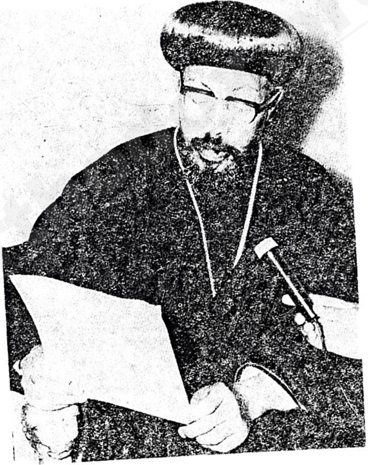
ብፁዕ ወቅዱስ ፓትርያርኩ ለምእመናን ቃለ ምዕዳን ሲያስተላልፉ ።

አስተዋይነትን ከመንፈሳዊ ዕውቀት ጋር አዋህደው በሚራመዱት ፓትርያርካችን ቤተ ክርስቲያናችን ትኩራለች ።