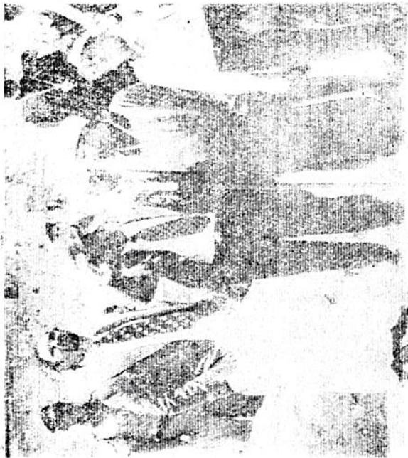
ቅዱስነታቸው የኢየሩሳሌምን ቅዱስ መካኒን እየተዘዋወሩ ሲመለከቱ ወደ ሲመለከቱ