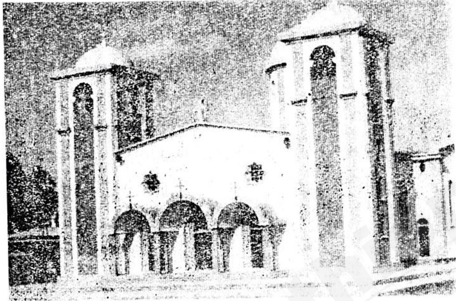
ብፁዕ ወቅዱስ ቀዳማዊ ቴዎድሎስ ፓትርያርክ ዘኢትዮጵያ በግል ገንዘባቸው ያሳነፁት የመካነ ሕያዋን ቅዱስ ገብርኤል ቤተ ክርስቲያን ይህ ነው ።

የኪራዩም ገቢ በጊዜው እየሰበሰበ በያንዳንዱ ቤተክርስቲያን ስም እባንክ የማስቀመጡ አላፊነት በደብረ ገነት ኤልያስ ደብር አስተዳዳሪ በድማኅ ገነቱና በመካነ ሕያዋን ቅዱስ ገብርኤል ቤተ ክርስቲያን አስተዳዳሪ በሁለቱ በሚመረጥ በአዲስ አበባ ተቀማጭ ለሆነ ሰው ይሰጣል ። አስፈላጊም ሆኖ ከተገኘ በሁለቱ አስተዳዳሪዎች በሚወሰነው መጠን ከገቢው አበል ሊከፈለው ይችላል ።