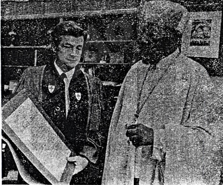
የቅዱስነታቸው ታላቅ መንፈሳዊ ተግባር በመመጠን የቦስቶን የኒበርስቲ የክብር ዲግሪ ሰጥቷቸዋል