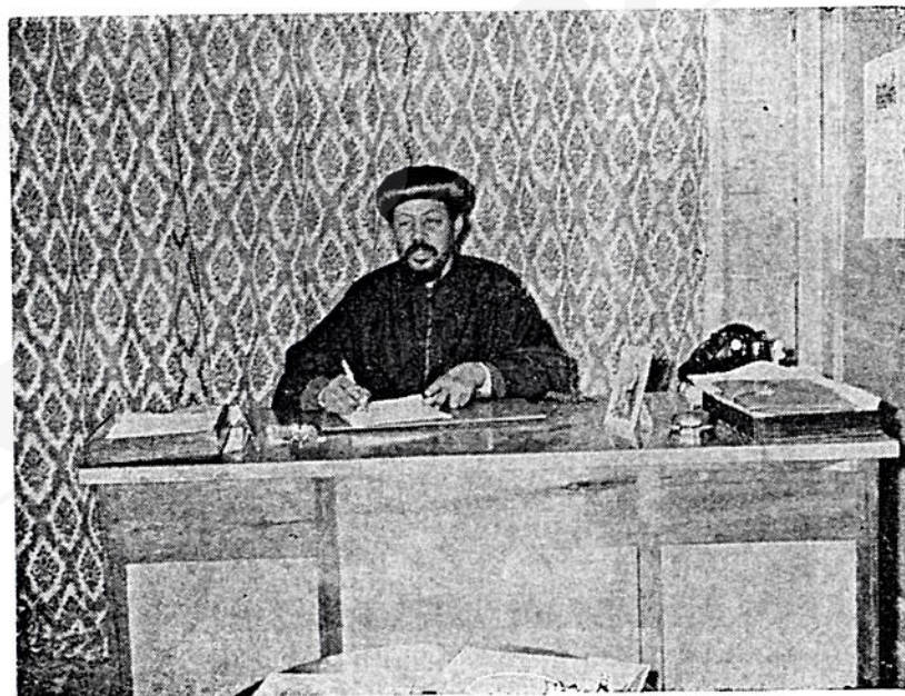
ብፁዕ ወቅዱስ ፓትርያርኩ ዕለታዊ ተግባራቸውን በጽሕፈት በታሸው እየተገኙ ያከናውናሉ ።