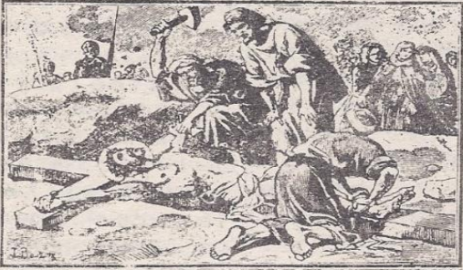
ዘከመ ፡ ቀነዉ ፡ እይ ሁድ ፡ በቅንዎት ።

እሶ ፡ በኅለት ፡ ወጸፍዕዎ ፡ ገጸ ፡ በእኪት ። ወእግ ዚእ ፡ ኢየሱስ ፡ ያረምም ፡ ወይትጊገሥ ፡ ዘንተ ፡ ኩሎ ፤ ወኢያውሥኦ ፡ ቃለ ፡ ከመ ፡ በግዕ ፡ በቀ ድመ ፡ ዘይቀርዖ ፡ ወየሐርዶ ፡ እስከ ፡ ይበጽሕ ፡ ዕድሜሁ ። ወከማሁ ፡ ኢነበበ ፡ በሕማሙ ፡ እስ ከ ፡ ይነሥእዋ ፡ ለሕይወቱ ። ወሶበ ፡ ፈጸሙ ፡ አ ይሁድ ፡ ምግባርሙ ፡ እኪተ ፡ እስመ ፡ ርጉማ ን ፡ ሕዝብ ፤ አዕረቅዎ ፡ ዘአልበስዎ ፡ ልብስ ፡ ቀ ይሐ ፤ ወአቅንትዎ ፡ ውስተ ፡ ሐቋሁ ። ወአሰር ዎ ፡ እደዊሁ ፡ ወእገሪሁ ፡ ዲበ ፡ ዕፀ ፡ መስቀል ፡ ወኅለቁ ፡ ኩሎ ፡ አዕፅምቲሁ ፤ ወቀነውዎ ፡ በ ቅንዎት ፡ ክልኤተ ፡ ቅንዎተ ፡ ውስተ ፡ እደዊሁ ፡ ወአሐደ ፡ ቀኖተ ፡ ውስተ ፡ እገሪሁ ። ወቀነውዎ ፡ ማእከለ ፡ ዕዕ ፤ ወአልዐሉ ፡ መስቀለ ፡ ወአቀምዎ ፡ በእገሪሁ ፡ እንዘ ፡ እሱራን ፡ ታሕተ ፡ ወእደዊሁ ፡ እሱራት ፡ ወስፋሐት ፡ በቅንዎት ፡ ላዕለ ፤ ወገ