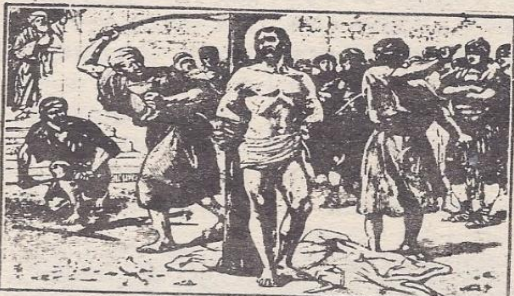
ዘከመ ፡ ቀሳፍም ፡ ሐራ ፡

ወአስተቀጻልም ፡ ላዕለ ፡ ርእሱ ፡ ወአልበስም ፡ ልብስ ፡ ሚላት ። ወይመጽኡ ፡ ኅቤሁ ፡ ወይቤል ም ፡ በሐከ ፡ ንጉሠ ፡ አይሁድ ፡ ወይጸፍዕም ፡ ገጸ ። ወወዕአ ፡ ከዕቦ ፡ ጳላጦስ ፡ አፍኣ ፡ ወይቤሎሙ ፡ ናሁ ፡ አወዕአ ፡ ለክሙ ፡ አፍኣ ፡ ከመ ፡ ታእም ሩ ፡ ከመ ፡ አልቦ ፡ ዘረከብኩ ፡ ላዕሌሁ ፡ ጌጋይ ፡ ወኢአሐቲኒ ። ወወዕአ ፡ እግዚእ ፡ ኢየሱስ ፡ አ ፍኣ ፡ እንዘ ፡ ይትቁጸል ፡ አክሊለ ፡ ሦክ ፡ ወይለ ብስ ፡ ሚላተ ፡ ወይቤሎሙ ፡ ጳላጦስ ፡ ነዋ ፡ ው እቱ ፡ ብእሲ ። ወዕቦ ፡ ርእይም ፡ ሊቃን ፡ ከህናት ፡ ወወዓልያኒሆሙ ፡ ከልሐ ፡ ወይቤሉ ፡ ስቅሎ ፡ ስ