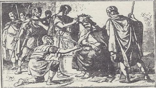
ዘከመ ፡ አስተቀጻ ልዎ ፡ አይሁድ ፡

ፀወ ፡ ጲበ ፡ ዐረዝየ ። ወነበሩ ፡ የዐቅብዎ ፡ ህየ ፤ ወአንበሩ ፡ መልዕልተ ፡ ርእሱ ፡ ጽሒርመ ፡ መ ጽሐፈ ፡ ጌጋዩ ፡ ዘይብል ፡ ዝ ፡ ውእቱ ፡ ንጉሦ መ ፡ ለአይሁድ ፡ ኢየሱስ ። ወእምዝ ፡ ተሰቅ ሉ ፡ ምስሌሁ ፡ ክልኡቱ ፡ ፈያት ፤ አሐዱ ፡ በ የማኑ ፡ ወአሐዱ ፡ በፀጋመ ። ወእለ ፡ የጎልፋ ፡ ያፀርፋ ፡ ላዕሌሁ ፡ እንዝ ፡ የሐውሱ ፡ ርእሶመ ፤ ወይብሉ ፡ አ ፡ ዘይነሥቶ ፡ ለቤተ ፡ መቅደስ ፡ ወ የሐንጾ ፡ በሣልስት ፡ ዕለት ፡ አድኅን ፡ ርእሰከ ፤ እመሰ ፡ ወልደ ፡ እግዚአብሔር ፡ አንተ ፡ ረድ ፡ እመስቀልክ ። ወከማሁ ፡ ሊቃነ ፡ ከህናትሂ ፡ ይ ሣለቁ ፡ ምስል ፡ ጸሐፍት ፡ ወሊቃናት ፡ እንዝ ፡ ይ ብሉ ፡ በዕደ ፡ አድኅነ ፡ ወርእሶ ፡ ኢይክል ፡ አድ ኅኖ ፡ እመ ፡ ንጉሠ ፡ እስራኤል ፡ ውእቱ ፡ ለይረ ድ ፡ ይእዜ ፡ እመስቀል ፤ ወንእመን ፡ ቦቱ ። ዘተ አመነ ፡ በእግዚአብሔር ፡ ናሁ ፡ ይእዜ ፡ ያድኅኖ ፡ እመ ፡ ይፈቅዶ ፡ እስመ ፡ ይብል ፡ ወልደ ፡ እግዚ