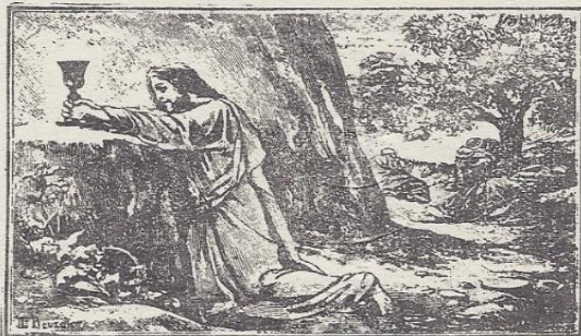
ዘከመ ፡ ጸሎ ፡ እግዚእን ፡

ወነሥአሙ ፡ ይሁዳ ፡ ለወገራተ ፡ ሰጲራ ፡ እምጎ በ ፡ ሊቃነ ፡ ካህናት ፡ ወፈሪሳውያን ፡ ወነሥአ ፡ ረድኤተ ፡ ወዓልያኒሆሙ ፡ ወሐረ ፡ ህዩ ፡ በመኃ ትወ ፡ ጽጉ ፡ ወፓናት ፡ ወበንዋዩ ፡ ሐቅል ፡ ወአ እሚር ፡ እግዚእ ፡ ኢዩሱስ ፡ ነሎ ፡ ዘይበጽሕ ፡ ላዕሌሁ ፡ ወዕአ ፡ አፍኦ ፡ ኅቤሆሙ ፡ ወይቤሎ ሙ ፡ መነ ፡ ተጎሥሡ ፡ ወአውሥኡ ፡ ወይቤል ዎ ፡ ኢዩሱስህ ፡ ናዝራዌ ፡ ወይቤሎሙ ፡ እግዚ እ ፡ ኢዩሱስ ፡ አነ ፡ ውእቱ ፡ ወሀለወ ፡ ይሁዳኒ ፡ ዘያገብአ ፡ ይቀውም ፡ ምስሌሆሙ ፡ ወሶበ ፡ ይ ቤሎሙ ፡ እግዚእ ፡ ኢዩሱስ ፡ አነ ፡ ውእቱ ፡ ገ ብኡ ፡ ደጎሪሆሙ ፡ ወወድቁ ፡ ዲበ ፡ ምድር ፡ ወእምዝ ፡ ካዕቢ ፡ ተስእሎሙ ፡ ወይቤሎሙ ፡ መነ ፡ ተጎሥሡ ፡ ወይቤልዎ ፡ ኢዩሱስህ ፡ ናዝ ራዌ ፡ ወአውሥኦ ፡ እግዚእ ፡ ኢዩሱስ ፡ ወይቤ ሎሙ ፡ አነ ፡ ውእቱ ፡ እቤለክሙ ፡ ወእመሰ ፡ ከ ያዩ ፡ ተጎሥሡ ፡ ጎድግዎሙ ፡ ለእሎ ፡ ይሐሩ ፡