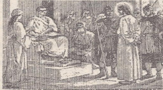
ዘከመ ፡ ንፀብ ፡ ጲላጦስ ፡ እደሁ ፡ በግድ ፡

ወንጌል ፡ ዘማርቆስ ። ወለለ ፡ በዓል ፡ ያሐዩ ፡ ሎሙ ፡ አሕደ ፡ እምነ ፡ ሙቁሐን ፡ ዘአብደሩ ። ወሀሎ ፡ አሐዱ ፡ ብእሲ ፡ ዘስሙ ፡ በርባን ፡ ሙቁሕ ፡ ምስለ ፡ እለ ፡ ገብሩ ፡ ሀከክ ፡ ወምስለ ፡ ቀተልተ ፡ ነፍስ ። ወዐርጉ ፡ ሕዝብ ፡ ወከልሐ ፡ ወሰአሉ ፡ ይግበር ፡ ሎሙ ፡ በከመ ፡ ያለምድ ። ወአውሥኦ ፡ ጲላጦስ ፡ ወይቤሎሙ ፡ ትፈቅዱን ፡ አሕዩዎ ፡ ለክሙ ፡ ለንጉሠ ፡ አይሁድ ፤ እስመ ፡ የአምር ፡ ከመ ፡ በቅንኦቶሙ ፡ አግብእዎ ፡ ሊቃን ፡ ከህናት ። ወሊቃን ፡ ከህናት ሰ ፡ ሆክዎሙ ፡ ለሕዝብ ፡ ከመ ፡ በርባንህ ፡ ይስአሉ ፡ ያሕዩ ፡ ሎሙ ። ወከዕብ ፡ አውሥኦ ፡ ጲላጦስ ፤ ወይቤሎሙ ፡ ምንተ ፡ እንክ ፡ ትፈቅዱ ፡ እረስዮ ፡ ለዘተብህለ ፡ ንጉሠ ፡ አይሁድ ፤ ወከዕብ ፡ ከልሐ ፡ ነሎሙ ፡ ወይቤሉ ፡ ስቅሎ ። ወይቤሎሙ ፡ ጲላጦስ ፡ ምንተ ፡ እኩዩ ፡ ገብረ ፡ ወፈድፋድ ፡ ጸርሐ ፡ ወይቤሉ ፡ ስቅሎ ። ወመከረ ፡ ጲላጦስ ፡ ይግበር ፡ ፈቃዶሙ ፡ ለሕዝብ ፤ ወአሕዩወ ፡ ሎሙ ፡ በርባንህ ፡ ወቀሠፎ ፡ ለእግዚእ ፡