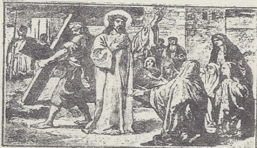
መስቀሉ ፡ ወዘከመ ፡ በህዮ ፡ እንስት ፡ ላዕለ ፡ እግዚእኒ ።

ልኤተ ፡ ፈያተ ፡ አሐደ ፡ በዩማኑ ፡ ወአሐደ ፡ በፀጋሙ ። ወተፈጸመ ፡ መጽሐፍ ፡ ዘይቤ ፡ ተኑሎቁ ፡ ምስለ ፡ ገበርተ ፡ ዐመፃ ። ወተላፍትኒ ፡ ይፀርፉ ፡ ላዕሌሁ ፡ ወየሐውሱ ፡ ርእሶሙ ፡ ወይብልዎ ፡ አ ፡ ዘይነሥቶ ፡ ለቤተ ፡ መቅደስ ፡ ወበሠሉስ ፡ ዕለት ፡ የሐንጸ ፡ አድጎን ፡ ርእሰክ ፤ ወረድ ፡ እመስቀልክ ። ወከማሁ ፡ ሊቃን ፡ ከህናትኒ ፡ ወጸሐፍት ፡ ይሃለቁ ፡ ላዕሌሁ ፡ ወይብልዎ ፡ ዘባዕደ ፡ ያድጎን ፡ ወርእሶ ፡ ኢይክል ፡ አድጎኖ ። ወከርስቶስ ፡ ንጉሠ ፡ እስራኤል ፡ ለይረድኬ ፡ ይእዜ ፡ እምን ፡ መስቀሉ ፤ ንርአይ ፡ ወንእመን ፡ በቱ ። ወእለሂ ፡ ተሰቅሉ ፡ ምስሌሁ ፡ ይዘነጉጉዎ ። ወሶበ ፡ ከነ ፡ ጊዜ ፡ ቀትር ፡ ጸልመ ፡ ፀሓይ ፤ ወ