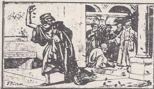
ወዘረወ ፡ ብሩረ ።

ወገደፊ ፡ ውእተ ፡ ብሩረ ፡ ውስተ ፡ ምኵራብ ፡ ወሐረ ፡ ወተጎንቀ ። ወነሥኡ ፡ ሊቃነ ፡ ከህናት ፡ ውእተ ፡ ብሩረ ፡ ወይቤሎ ፡ ኢየሱስ ፡ ንደዮ ፡ ውስተ ፡ ቀሩርባን ፡ እስመ ፡ ሤጠ ፡ ደም፤ ውእ ቱ ። ወተግኪርሙ ፡ ተግዮጦ ፡ ቦቱ ፡ ምድረ ፡ ሉብሓዊ ፡ ለመቃብረ ፡ እንግዳ ። ወተሰምዩ ፡ ው እቱ ፡ ገራህት ፡ ገራህተ ፡ ደም ፡ እስከ ፡ ዮም ። ወይእተ ፡ አሚረ ፡ በጽሐ ፡ ቃለ ፡ ኤርምያስ ፡ ነ ቢይ ፡ ዘይቤ ፡ ወነሥኡ ፡ ሠላሳ ፡ ብሩረ ፡ ሤጠ ፡ ለክቡር ፡ ዘአክቡሩ ፡ እምደቂቀ ፡ አስራኤል ። ወ ወሀብዎ ፡ ለገራህተ ፡ ሉብሓዊ ፡ በከመ ፡ አዘዘኒ ፡ እግዚእ-ብሔር ። ወቆመ ፡ እግዚእ ፡ ኢየሱስ ፡ ቅ ድሚሁ ፡ ለመልአክ ፡ አሕዛብ ፡ ወተስእሎ ፡ መል አክ ፡ አሕዛብ ፡ ወይቤሎ ፡ አንተሁ ፡ ንጉሥሙ ፡ ለአይሁድ ፡ ወይቤ ፡ እግዚእ ፡ ኢየሱስ ፡ አንተ ፡ ትቤ ። ወእንዘ ፡ ያስተዋድደዎ ፡ ሊቃነ ፡ ከህናት ፡ ወሊቃውንተ ፡ ሕዝብ ፡ አልቦ ፡ ዘያውሥኡሙ ፡