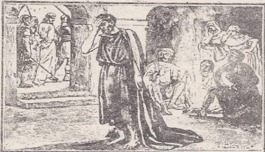
ዘክመ ፡ ንስሐ ፡

ወንጌል ፡ ዘሉቃስ ። ወርእዮቶ ፡ ወላት ፡ እንዘ ፡ ይነብር ፡ መንገል ፡ በር ህ ፡ ወተጠየቀቶ ፤ ወትቤ ፡ ዝኒ ፡ ምስሌሁ ፡ ሀሎ ። ወክሕደ ፡ ወይቤላ ፡ ብእሲቶ ፡ ኢየሐምር ፡ ለዘት ብሊ ። ወእምድጎረ ፡ ሕቅ ፡ ርእዮ ፡ ካልእ ፤ ወይ ቤሎ ፡ አንተሂ ፡ እምኒሆሙ ፡ አንተ ። ወይቤሎ ፡ ጴጥሮስ ፡ አንተ ፡ ብእሲ ፡ ኢኮንኩ ። ወጎሊፎ ፡ መጠነ ፡ ሰግት ፡ ዐጠቆ ፡ አሐዱ ፡ ካልእ ፤ ወይቤ ሎ ፡ አማን ፡ ዝንቱሂ ፡ ምስሌሁ ፡ ሀሎ ፤ ወገሊ ላዊ ፡ ውእቱ ። ወይቤሎ ፡ ጴጥሮስ ፡ አንተ ፡ ብ እሲ ፡ ኢየሐምር ፡ ለዘትብል ። ወእንዘ ፡ ይትናገ ር ፡ ነቀወ ፡ ዶርህ ፡ ሶቤሃ ። ወተመይጠ ፡ እግዚ እነ ፡ ኢየሱስ ፡ ወንጸሮ ፡ ለጴጥሮስ ፡ ወተዘከረ ፡ ጴጥሮስ ፡ ቃሎ ፡ ለእግዚእነ ፡ ዘይቤሎ ፡ ሥልሰ ፡ ትክሕደኒ ፡ ዮም ፡ ዘእንበለ ፡ ይንቁ ፡ ዶርህ ። ወ