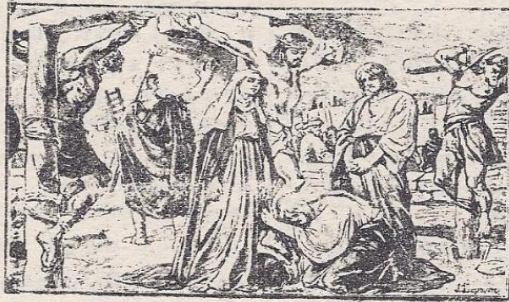
ዘከመ ፡ ሞተ ፡ እግዚእ ፡

እምትውልደ ፡ ትውልድ ፡ ዓመቲክ ፡ ኢተኅልቅ ፤ ወእምቅድመ ፡ ፀሓይ ፡ ሀሎ ፡ ስምክ ። ተርእይክ ፡ ዮም ፡ ስቀለ ፡ ዲቦ ፡ ዕፅ ፡ መስቀል ፤ አ፡ ፍላጊሆሙ ፡ ለካሉ ፡ ፍጥረት ፡ እፎ ፡ ደፈሩ ፡ ላዕልክ ፡ ፀላውያን ፡ እሊአክ ። አ ፡ ለብሐዊ ፡ ዘሰሐብ ፡ ኅቤሁ ፡ ልከካተ ፤ አ ፡ ዐቃቤ ፡ ሥራይ ፡ ዘበአማን ፡ ቍሱላኒሆሙ ፡ ፈወስክ ። አዕረገኩ ፡ ዲቦ ፡ ዕፅ ፡ ከመ ፡ ገባረ ፡ እከይ ፡ ሕገብ ፡ ዘምሉአን ፡ ኅጢአተ ፡ እልክቱ ፡ እለ ፡ አልዐ