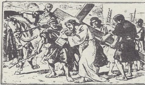
ዘከመ : አጻርዎ : አይሁድ :

ወይቤሎሙ : ጲላጦስ : ለንጉሥክሙት : እስቅ ሎ : ወአውሥኦ : ሊቃን : ካህናት : ወይቤሎ : አልብን : ንጉሥ : ዘእንበለ : ቂሳር ። ወእምዝ : ወሀቦሙ : ይስቅልዎ ። ወተመጠውዎ : ለእግዚ እ : ኢየሱስ : ወአውዕእዎ : ወወሰድዎ : እንዘ : ይጸውር : መስቀሎ : ውስተ : መካን : ዘስሙ : ቀራንዮ : ወበዕብራይስጥ : ይብልዎ : ጎልጎታ ። ወሀዩ : ሰቀልዎ : ወሰቀሉ : ምስሌሁ : ካልኦን : ክልኤተ : ፈያተ : አሐደ : እምለፌ : ወአሐደ : እምለፌ : ወማእከሎሙ : ኢየሱስህ ። ወጸሐፈ : ጲላጦስ : መጽሐፈ : ወእንበረ : ዲቦ : መስቀሉ ፤ ወይብል : መጽሐፍ : ኢየሱስ : ናዝራዊ : ንጉ ሦሙ : ለአይሁድ : ውእቱ : ዝንቱ ። ውብዙኃ ን : እምን : አይሁድ : እለ : አንቡብዋ : ለይኦቲ : መጽሐፍ : እስመ : ቅሩብ : ውእቱ : መካን : ለ