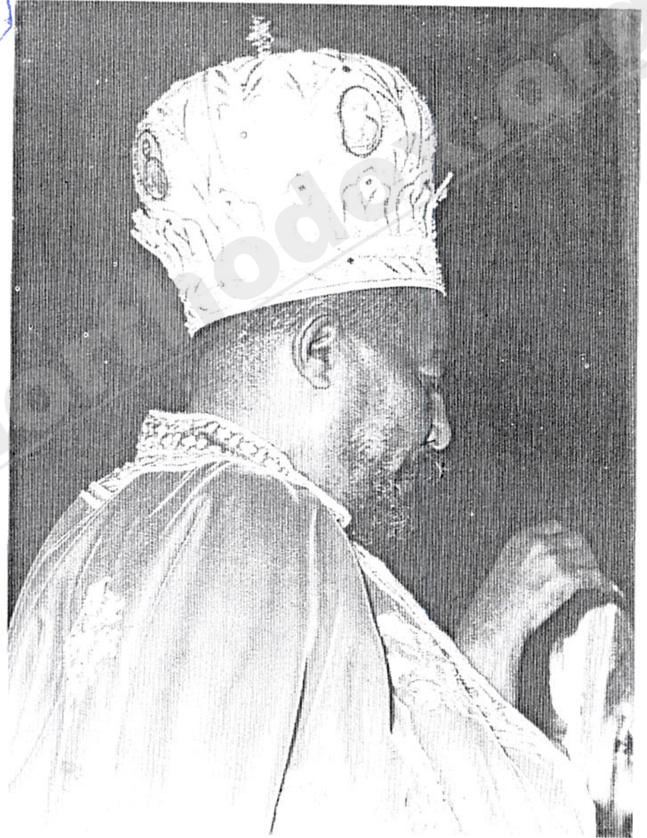
ብዑሳ ወቅዲስ ቀዳማዊ ቴዎድሎስ ርእሰ ሊዎነ ጳጳሳት ፓትርያርክ ዘኢትዮጵያ