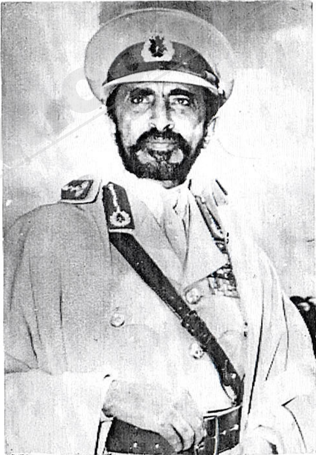
ግርማዊ ቀዳማዊ ኃይለ ሥላሴ ንጉሠ ነገሥት ዘኢትዮጵያ