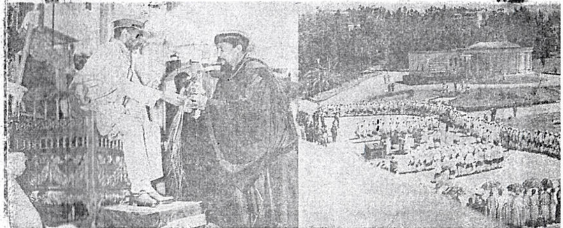
ገርማዊ ጳጳሆይ በአፄ መስቀል በዓል ላይ ከጠዕዕ ወቅዱስ ፓትርያርኩ ጉንጉን አበባ ሊቀበሉ ።