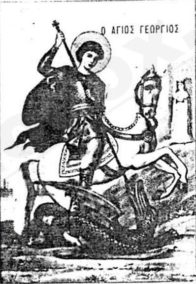
ቅዱስ ጊዮርጊስ ሰማዕት ልላ

እንደሞተ አልቀረም አሁንም ለሦስተኛ ጊዜ ተነሥቶ የማስተማር ተግባሩን ቀጠለ፣ ቅዱስ ጊዮርጊስ ተጋድሎውን ሲጀምር ሦስት ጊዜያት ሞቶ እንደሚነሣ ከፈጣሪው ተነግሮት ነበር በዚህ መሠረት ተጋድሎውን ወደማገባደዱ ተቃርቧል አሁን ደግሞ በረኅብ ለመገደል አስበው ምንም ከሌላት ድሃ መበለት ቤት ወስደው ከምሰሶ ጋር አሠሩት እርሱም በጸለየ ጊዜ የታሠረበት ምሰሶ አለመለመና አፈራ ፍሬውንም ተመገብ ለመበለቷም ፅውር ዳዳ ደንቆር ሽባ ልጅ ነበረት አምጥታ ቅዱስ ጊዮርጊስ ለውሳኔ ታልታል፣ ንጉሡ ጁድያኖስ በዚያም በዚያም ቢል ለማሸነፍ ባለመቻሉ ልጅን አጋብቶ ለመንግሥቱ ገብቶ የማስተማር መንገድ በማግኘቱ በጣም ተደሰት ፈቃደኛ መሆኑንም ለጁድያኖስ ስለገለጸለት ወዲያው ወደ ቤት መንግሥቱ እንዲገባ አደረገ፣ ቅዱስ ጊዮርጊስም ከቤተ መንግሥቱ እንደገባ የማስተማር ተግባሩን ቀጥሎ ሲያስተምር የንጉሡ ጁድያኖስ ሚስት ለምታ በአምላክ ጊዮርጊስ አመንኩኝ ብላ የክርስትና እምነትን ተቀበለች ጁድያኖስ ከአ