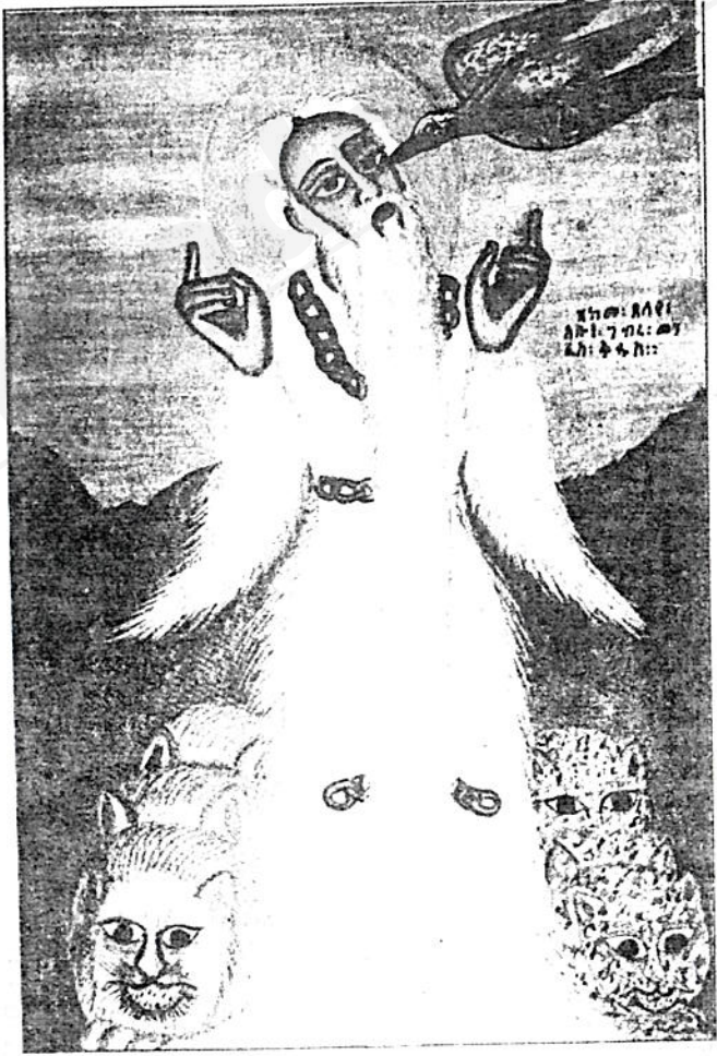
ዛሬ - አባት ገብረ መንፈስ ቅዱስ በፈላጊ ሕይወት ፀሎተ