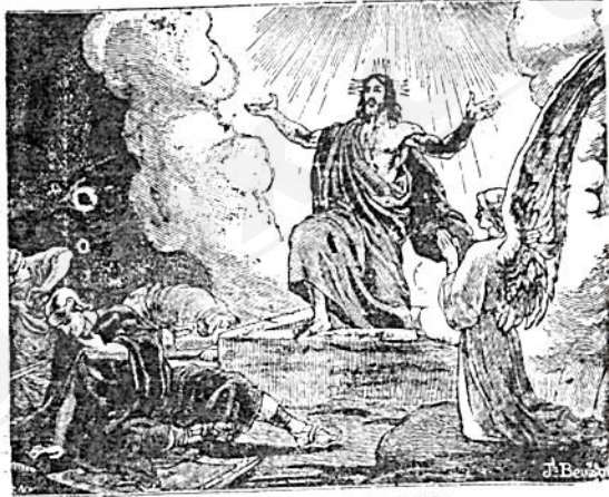
ዘው ተንግሥ እግዚአብሔር እምላክነት መቃብር

በሌላም በኩል ሰንበት እንደ ምን ነበር ጌታ በመቃብር ከዋለባትና ካደረሰት በኋላ ግን ስለተጸደቀ ቅዳሜ ሥዕር ተባለች ። ባለቤት ቀን መጸም እንደሚያገባ ያችን ጌታ በመቃብር እውስጥ