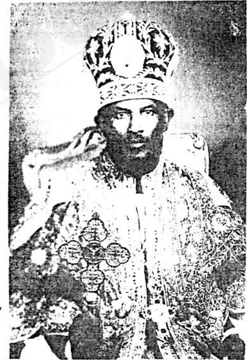
ብፁዕ ሠቅዱስ አቡነ መርቆራዎስ ፓትርያርክ ርእሰ ሊቃና ጳጳሳት ዘኢትዮጵያ