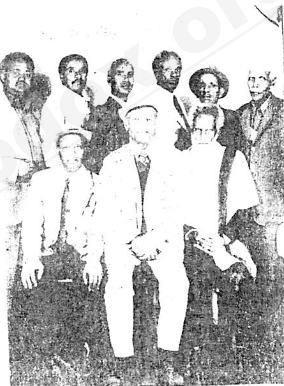
ገቢ ሰዎች ዕድር ሥራ ለመሪ ለባላት እነዚህ ግራ

የመንበረ ልዑል ቅዱስ ማርቆስና ቅ/ሚካኤል ቤ/ክርስቲያን ሰበሳ ጉባኤ ለባሕራው ሰዎች ላቀሙት የጭን ግንባር ዘገባ ረዳት ማሰሪያ ደብር ለጭካኔ ለደረጃው በ፲፱፻፳፩ ዓ/ም የጥምሳ ትግ የጭን ግራ ሰበሳ ጉባኤ ገንገጦችን ማካናቀቅ በማድረግ ሰዎች