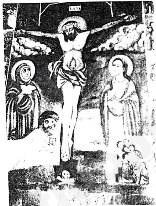
ዘው ተሳታፊ እግዚአብሔር በሙሉ ለሰንበት

ቀዳሚት ሰንበት ከሰባት ዕለታት አንድዋን ሰባተኛይቱ ቀን ናት ስምዋም ቅዳሜ ቀዳሚት ሰንበት እየተባለች ትጠራለች ይህም ስያሜ እንዲሁ በሰው ፈጠራ የመጣ አይደለም ቀደም ሲል በዘመነ ብሉይ እግዚአብሔር ሕገ ኦሪትን ሲሠራ ፊቱ ቃላትንም በእጁ ጽፎ ለሙሴ በሰጠበት ወቅት ከገቱ ቃላት አንዲቱና ሰባተኛውን ተንጠላክብሮ ሰንበት ለእግዚአብሔር እምላክነት የእምላክነት የእግዚአብሔርን ሰንበት አክብሮ ስድስቱን ቀን ሥራህን ሥራ ተግባርህንም ሁሉ አርግ ሰባተኛይቱን ቀን ግን ለእግዚአብሔር ለአምላክ ናት በማለት ሰንበት ብሎ ራሱ እግዚአብሔር ስያሞኑታል ።