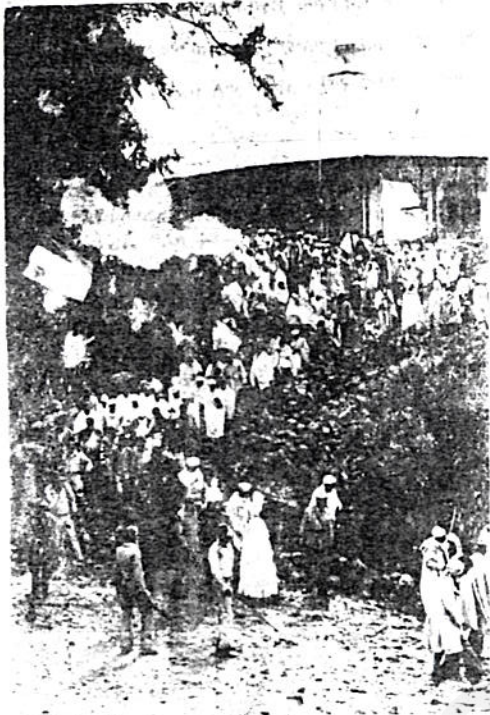
ቅዱስነታቸው በእንክብር ቅዱስ ሚካኤል ቤተ ክርስቲያን አስተዳደሩ ሲመለሱ

ከዚህ በኋላ ብፁዕ ወቅዱስ አቡነ ተክለ ሃይማኖት ፓትርያርክ ርእሰ ሊቃነ ጳጳሳት ዘኢትዮጵያ ከብፁዓን ሊቃነ ጳጳሳትና ጳጳሳትን እንዲሁም የቤተ ክህነትን ሹማምንት እስክትለው ወደ አዲስ አበባ መንበረ ካናቸው ሲመለሱ ሕዝቡ በከፍተኛ ስሜት ሸንፎአቸዋል ።