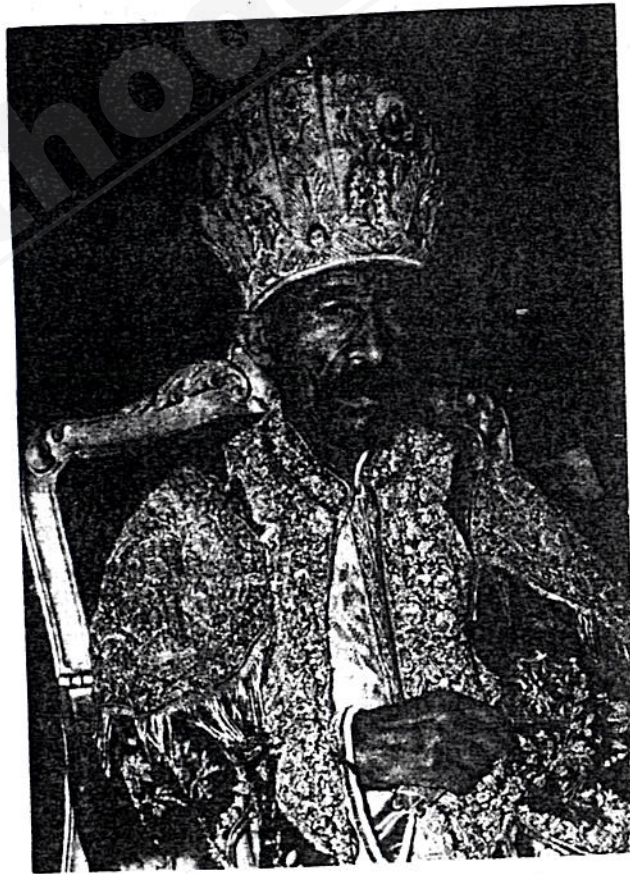
ቡድን ግሥት ለቡን ተክለ ሃይማኖት ፓትርያርክ ርእሰ ሊቃነ ጳጳሳት ዘኢትዮጵያ ።