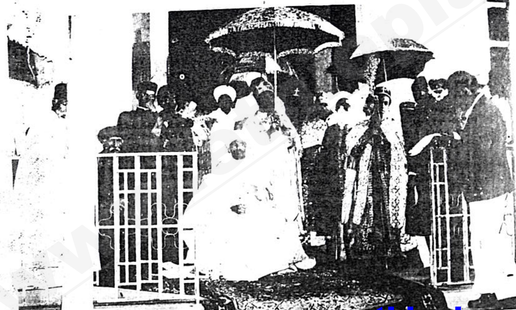
ቅዱስ ነታቸው በደብረ ብርሃን ሥላሴ ዓወድ ምሕረት ሆነው የሊቃውንትን ያረገሩ ሙዚ-ር ሲያሰሩ

የተሞላበት አቀባበል ስላለደረጉላቸው አመስግነው ቅዱስነ ታቸውም ናላዊ ምእመናን እንደ መሆናቸው መጠን ስለምእመናን መንገዳቸው ሲሉ ይህን አድካሚ ጉዞ ሳይ ሰቀቱ ወጥተው ወርደው በዛሬው ዕለት በመካከላችሁ በመገኘታቸው ልትደሰቱ ይገባችኋል በማለት ሰፊ ገለጻ አድርገዋል ። ከዚህቀጥሎም ብፁ-ዕ ወቅዱስ አቡነ ተክለ ሃይማኖት በዓሉን የሚመለከት ቃለ በረከት አሰምተዋል