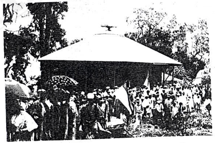
ቅዱስ ፓትርያርኩ ጥንታዊውን የአንኮበር ቅዱስ ጊዮርጊስ ቤተ ክርስቲያን በጎበኙበት ወቅት