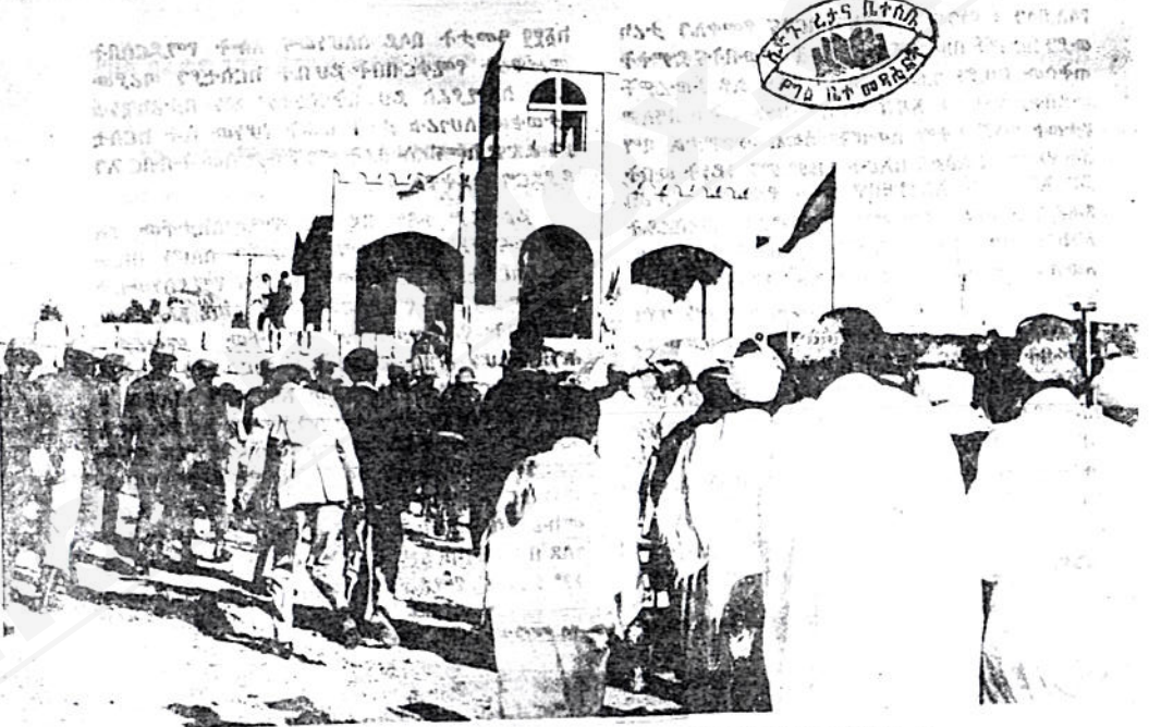
ቅዱስነታቸው ወደ ጳጳሱ የወደኋላ ገለግ ቤተ ክርስቲያን ገብተው የሕልና ጸሎት ሲያደርሱ ።

ቤተ ክርስቲያን እንደ በአንድ ጎብኝተዋል ይህ ቤተ ክርስቲያን ከዘመን ብዛት አርጅቶ ስለፈረሰ በአሁኑ ጊዜ በመታኛ ያለ ነው አዲሱ ቤተ ክርስቲያንም ሥራው በመገባ ደድ ላይ መሆኑን ቅዱስነታቸው ተመልክተዋል ። ከዚያም በዚህ ቤተ ክርስቲያን አቅራቢያ የሚገኘውን በእጣልያ ጊዜ ተሠርቶ ሲያልቅ ጥንታዊው ቤተ ክርስቲያን በመብረቅ ተቃጥሎ አሁን በመታኛ የሚገኘውን የመድኃኒት ዓለምን ቤተ ክርስቲያን ጎብኝተው ለጅ ደቂቃ ጸሎት አድርገዋል ። እንደገና ታላላቅ የአገራው ተወላጅ ችም በመቀበል እንዳንድ ዐበይት ጉዳዮች በመጠየቅ