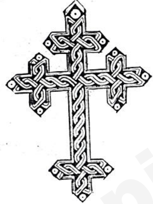
መስቀል ኃይላችን ነው

መስቀሉ የተቀበረበትን ለመፈለግ ወደ ኢየሩሳሌም ወጣች በመጀመሪያ አዋቂዎችን አስጠራች የተቀበ ረበትን ቦታ እንዲነገሩት ጠየቀች ቦታውንም ነገሩት ከነገሩትም መካከል ሸግግራው ከራኮስ ይገኝበታል። እውነቱንም ለግወት ደመራ አስ ደመረች አጣንም አስጨሰች ደመራውንም እንዲ ቃጠል አስደረገች ቱርጭ አስጀመረች መስቀሉ በተገኘ ጊዜ ችቦ እንዲበራ አስደረገች።