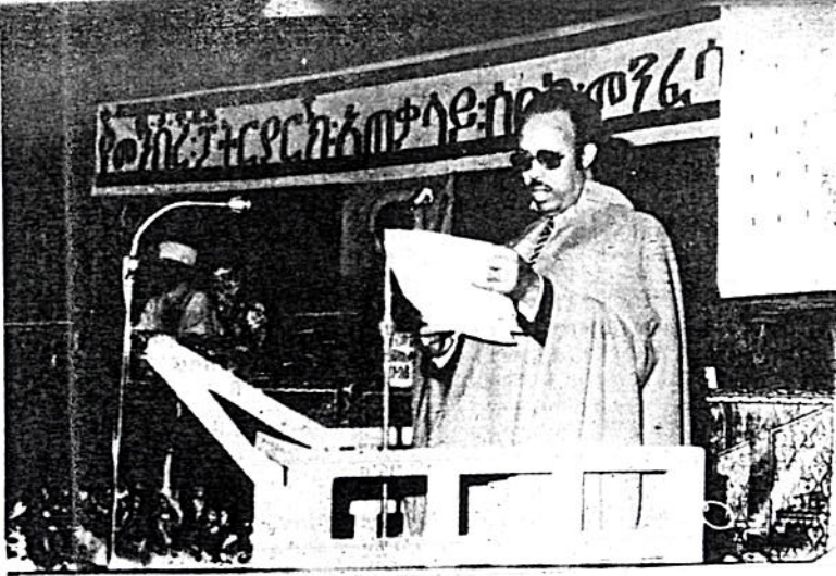
ሊቀ ግዳማ ለበዓል ደግሞ በሁለተኛው ሰዓቲ የሰበካ ጉባኤ ላይ ገንጠር ሲያደርጉ

ለም ። መቼም ብዙ ሥራ ተወርቷል ተብሎ ባለ ፈው ሥራ ብቻ መኖር ስለማይቻል አስተዳደሩ ለወደፊት ሊሠራ ያቀደው ሥራ ከአለ ቢያብራሩልን?