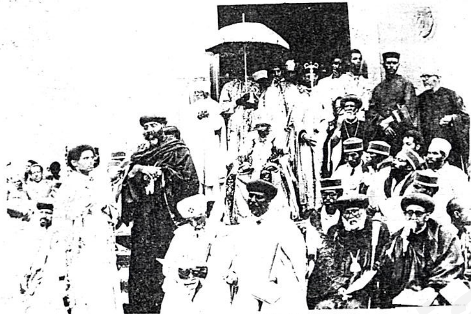
በብፁዕ ወቅዱስ አቡነ ተክለ ሃይማኖት በዓለ ሢመት ዕለት በፁዕ አቡነ ጎርጎርዮስ ንግግር ሲያደርጉ