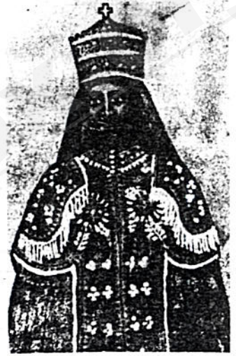
ጸሩ ቅዱስ ሐርቤ

የሚባሉ ደጋግ ነገሥታት ነግሠውባታል ቅዱስ ሐርቤ ከነዚህ ውስጥ የንጉሥ ዛን ሥዩም ልጅ ነው ለባቱ ዛን ሥዩም ከመንገሡ በፊት የዋግሹም ሁና ሲያስተዳድር ዑጽፍተ ወርቅ የምትባል ሴት አግብቶ ይህን ስመ ጥሩውን ጻድቅ ሐርቤን የካቲት ፲፮/፳፯ ዓ/ም ወለደ ፤ ሕጻንም በመልካም እንክብካቤ አድኅ ዘጠኝ ዓመት ሲሆነው በቤተ መንግሥቱ ውስጥ መምህር ተቀጥሮለት በሚገባ ንባብና ዳዊት ከቃል ትምህርት ጋር ተማረ ቀጥሎም ፤ ወደ ብልባል ጊዮርጊስ ሂዶ ከመምህር ሰይፈ ያፈድ ዘንድ ቅድና ሥርዓተ ቤተ ክርስቲያንን በሚገባ ከጽሕፈት ሙያ ጋር ተማረ ። ከዚያም ወደ ደብረ ሮሀ ተመልሶ ሥርዓተ መንግሥት እየተማረ እንደቆየ ቤተ ክርስቲያንንም ጻደቆን በመሆን አገልግሎአል ።