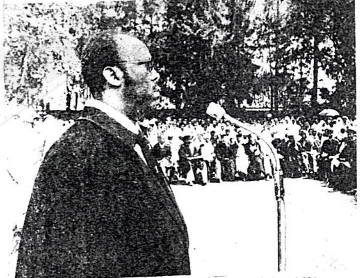
ሊቀ ማእምራን አበባው ይግዛው በቅዱስነታቸው በዓለ ሢመት ዕለት ንግግር ሲያደርጉ

ሁሉ መከራ ስትቀበል ኑራለች ምንም እንኳን በሥጋዊ በኩል በጀግናት ልጆቿ ነጻነቷና ክብሯ ተጠብቆ ቢኖርም በመንጠራላዊ አስተዳደር በባዕዳን ሥር እንደቆየች ግልጽ ነው ። ይህች ቤተ ክርስቲያን ክርስቲያኖች ሐዋርያዊት እንደመሆን መጠን ቅዱስ ጳውሎስ ወናሁ ሐሊበ ወጋዕክሙ - - - ሲል እንደተናገረው በዘመነ ነቢያት የትንቢት ፣ በዘመነ ሐዋርያት የስብከት ትምህርቷን በመመገብ የኢት/ሕዝብ ሃይማኖቱን ጠብቆ እንዲኖር ያደረገች ስትሆን አልፎ አልፎ ችግር ይደርስበት ነበር ።