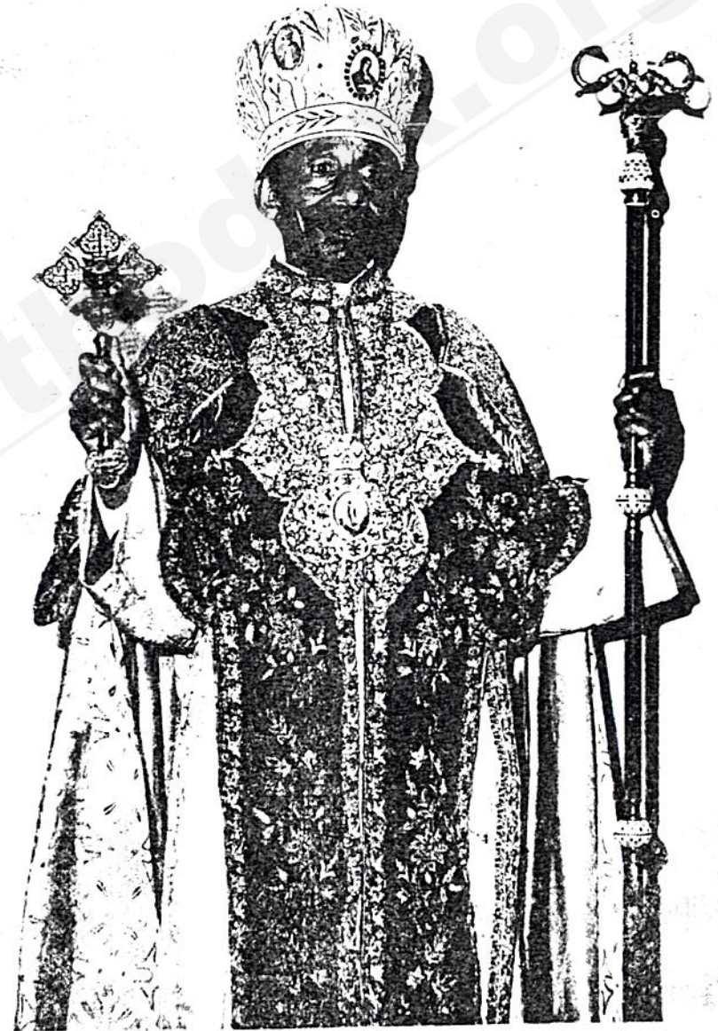
ብፁዕ ወትዕዝ አቡነ ተክለ ሃይማኖት ፓትርያርክ ከኢትዮጵያ